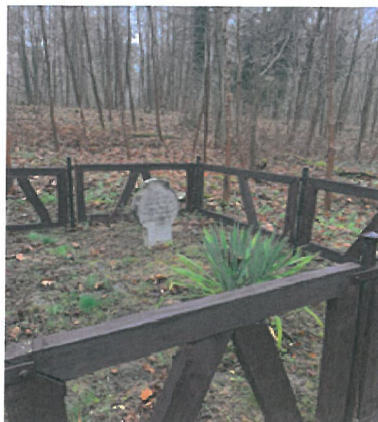
Cmentarz 1 Maja

2. W 2023 roku wykonane zostały prace bieżącego utrzymania na terenie cmentarzy wojennych oraz kwater z mogiłami wojennymi na cmentarzach ewangelickich przez pracowników Przedsiębiorstwa Usług Komunalnych w Orzyszu. W okresie wiosenno-letnim wykonano prace porządkowo – pielęgnacyjne terenu cmentarzy i kwater z mogiłami. Przeprowadzone zostały prace pielęgnacyjne w zakresie wykoszenia z oczyszczeniem porastającej roślinności i usunięciem zgromadzonych odpadów oraz dzikich zakrzaczeń wraz z połamanymi i wyciętymi gałęziami drzew. W ramach prac porządkowo – oczyszczających w w/w okresie przygotowano tereny cmentarzy i kwater i mogił dla osób odwiedzających. W okresie przed listopadowym świętem zmarłych uporządkowano i usunięto suche odpady roślinne. Wydatki w kwocie 11 000,00 zł związane z realizacją zadania poniesione zostały z dotacji z budżetu wojewody.