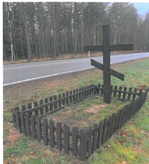
Mogiła Rostki Skomackie