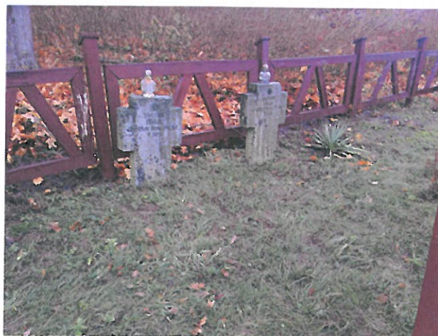
Cmentarz Cierzęty wieś

W 2022 r. dzięki dofinansowaniu uzyskanym w 2021 r. ze środków Ministra Kultury i Dziedzictwa Narodowego pochodzących z Funduszu Promocji Kultury w ramach programu „Groby i cmentarze wojenne w kraju”, przeprowadzono prace renowacyjne na cmentarzu wojennym z czasów I wojny światowej (Seehöhe Nr 116) w Cierzętach. Cmentarz został zrekonstruowany i odnowiony zgodnie z zasadami cmentarnictwa I wojny światowej. Na podstawie archiwalnych zdjęć odtworzono bramę będącą wejściem na cmentarz oraz zamontowano ogrodzenie.