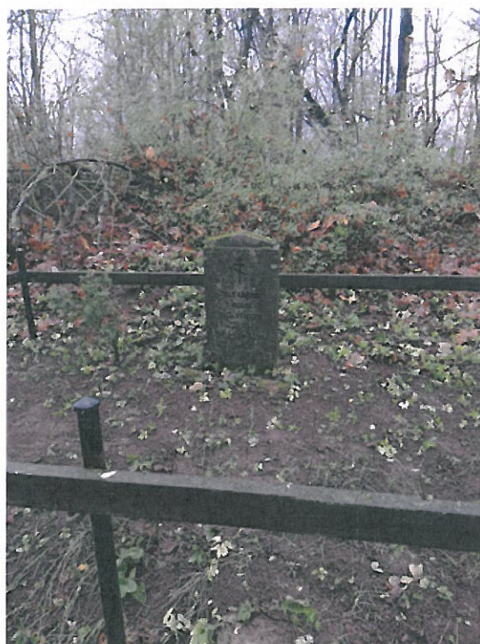
Cmentarz Nowa Wieś